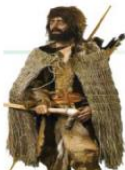
Зураг 1.1. "Өтци" хөндийгөөс 1991 онд олдсон "цасан доорх

2. Дараах зургийг ажиглаад асуултад хариулаарай