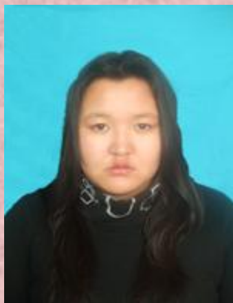
Нармандах Ууганбаяр 1-р сургууль 116