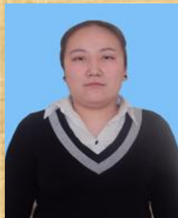
Эрдэнэбаатар Нандин-Эрдэнэ 8-р сургууль 116 Б.Уранчимэг