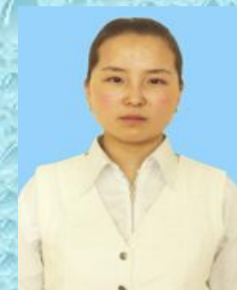
Энхжаргал Соёлжингоо 8-р сургууль 116 Г.Михлай