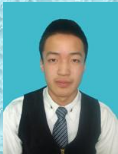
Олдох Жавхлантөгс 1-р сургууль 11а Ц.Эрдэнэсүвд