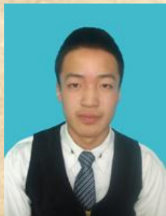
Олдох Жавхлантөгс 1-р сургууль 11а