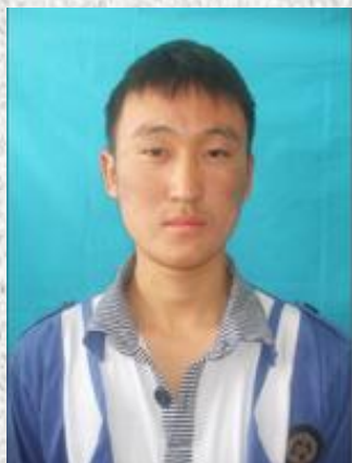
Нямрагчаа Нямсүрэн 5-р сургууль 11г Д.Октябрь