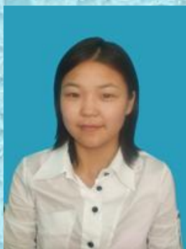
Одонжавхлан Бэсүдэй 1-р сургууль 116 Ц.Эрдэнэсүвд